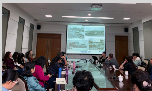
Vortrag am 11. September 2019 an der Innermongolischen Universität in Hohhot

ten, wie die Mongol*innen in ihrem historischen Gebiet innerhalb der Volksrepublik China als Minderheit leben. Die Han-Chines*innen bilden mittlerweile die Bevölkerungsmehrheit, während sich der Anteil der Mongol*innen auf etwa zehn Prozent beläuft. 1 Die mongolische Sprache und die klassische mongolische Schrift als Amtsschrift sind neben dem Chinesischen im Autonomiegebiet gesetzlich verankert.