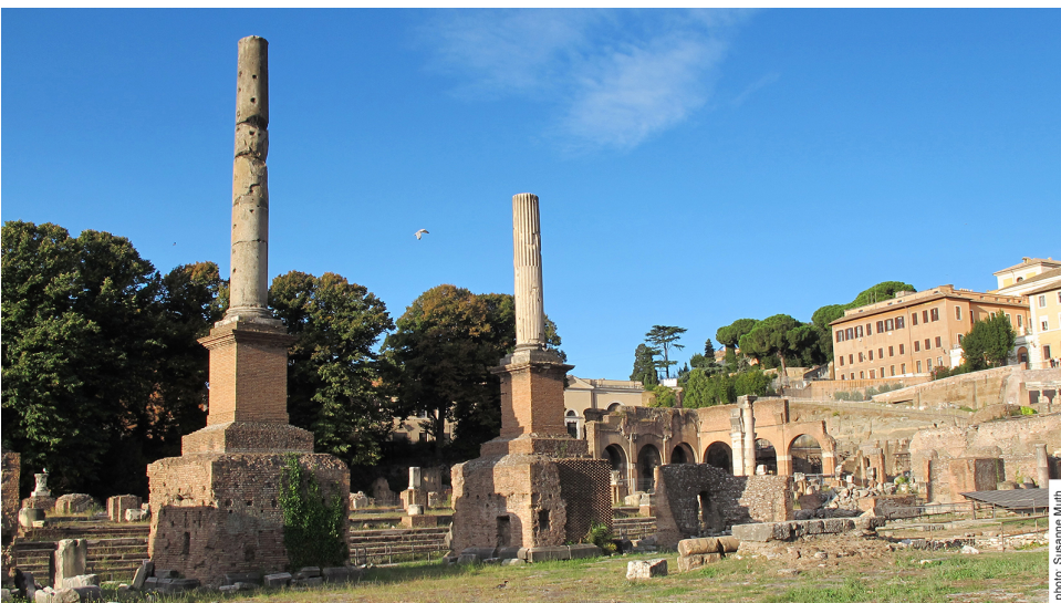
Abbildung 3 Spätantike Säulenmonumente, heutiges Erscheinungsbild

Zitieren nach: Bartz, Jessica. „Die Säulenmonumente an der Südseite“, digitales forum romanum, http://www.digitales-forum-romanum.de/gebaeude/saeulenmonumente-an-der-suedseite/ (abgerufen am Tag.Monat.Jahr )