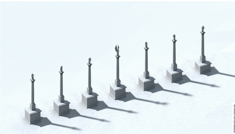
Abbildung 2 Spätantike sieben Säulenmonumente (Anfang 4. Jh. n.Chr.)