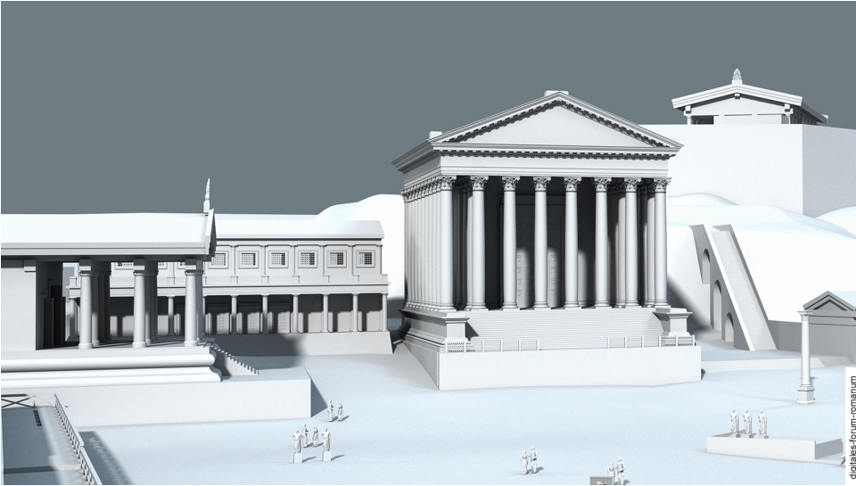
Abbildung 1 Basilica Opimia in der Späten Republik (um 100 v.Chr.), topographischer Kontext