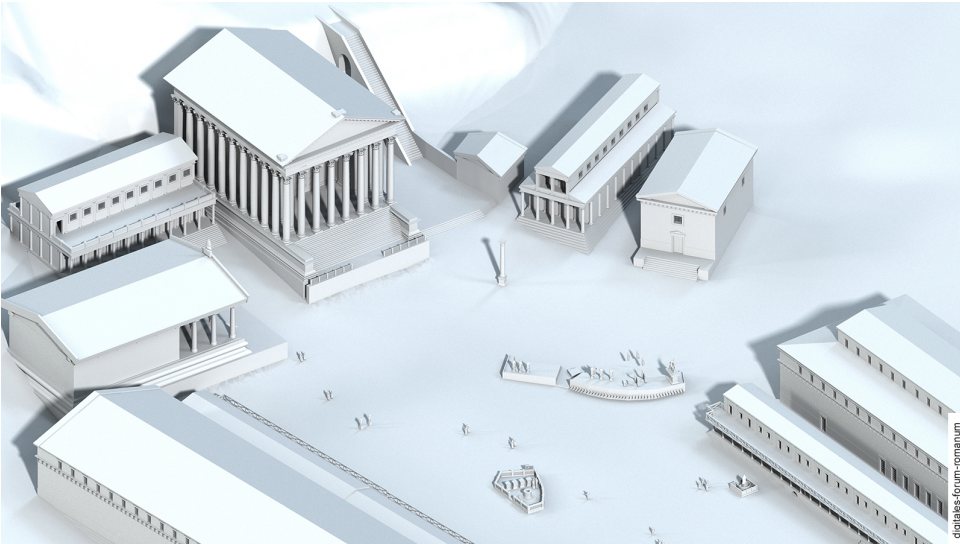
Abbildung 1 Basilica Opimia in der Späten Republik (um 100 v.Chr.), topographischer Überblick