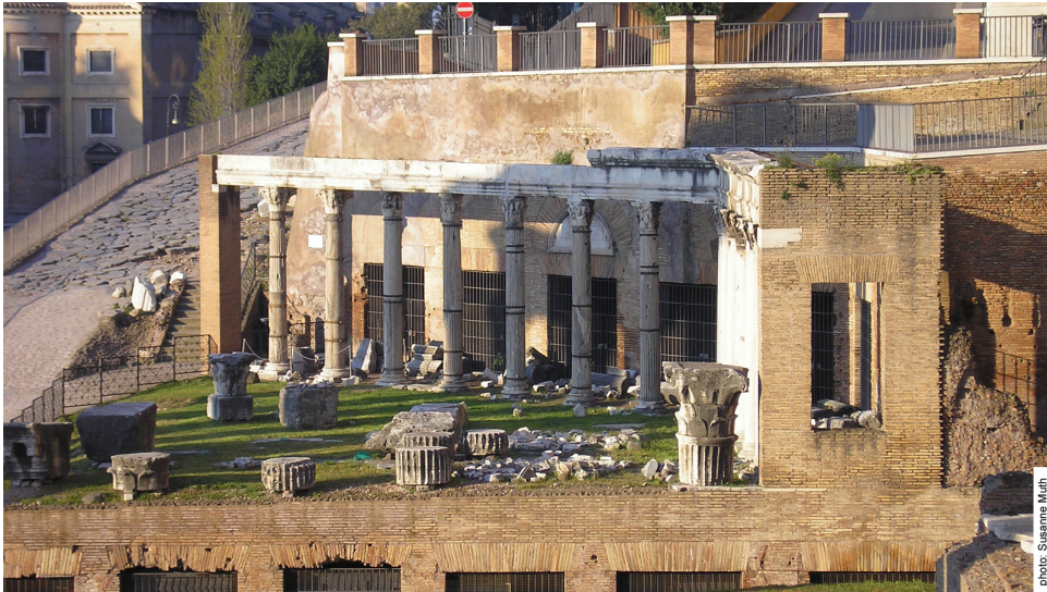
Abbildung 2 Porticus Deorum Consentium im Kontext der heutigen Ausgrabungsstätte