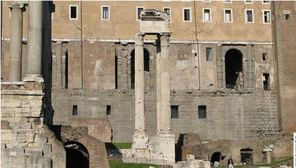
Abbildung 4 Vespasianstempel, heutiges Erscheinungsbild

Nutzung von Bildern und Texten aus dem ‚digitalen forum romanum‘