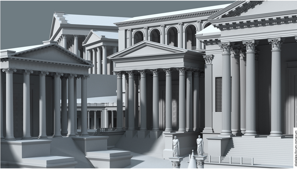
Abbildung 1 Vespasianstempel in flavischer Zeit (um 96 n.Chr.), topographischer Kontext