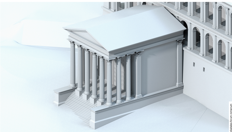
Vespasianstempel (79-96 n.Chr.)

Zitieren nach: Muth, Susanne. „Der Vespasianstempel“, digitales forum romanum, http://www.digitales-forum-romanum.de/gebaeude/vespasianstempel/ (abgerufen am Tag.Monat.Jahr)