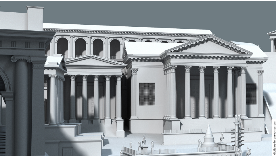
Abbildung 2 Vespasianstempel in flavischer Zeit (um 96 n.Chr.), topographischer Kontext