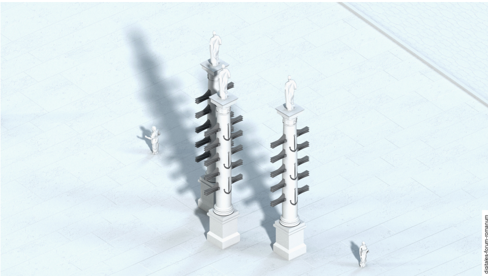
Abbildung 2 Columnae Rostratae Augusti (36-29 v.Chr.)