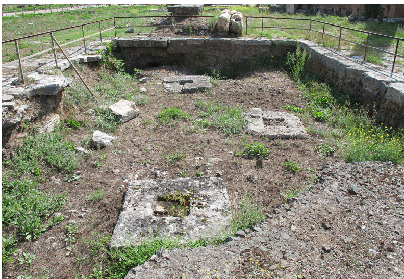
Abbildung 3 Columnae Rostratae Augusti, heutiges Erscheinungsbild der vermutlichen Standortes

Zitieren nach: Muth, Susanne. „Die Columnae Rostratae Augusti“, digitales forum romanum, http://www.digitales-forum-romanum.de/gebaeude/columnae-rostratae-augusti/ (abgerufen am Tag.Monat.Jahr )