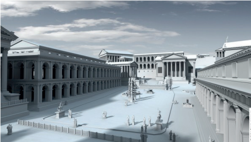
Abb. 1 Forum unter Augustus (um 14 n.Chr.), Blick von Osten