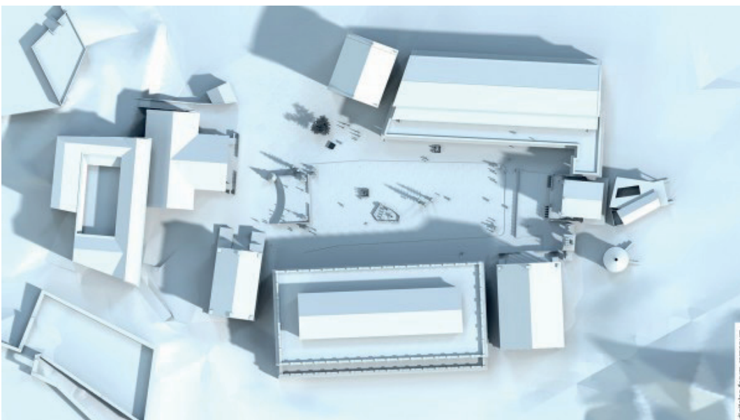
Abb. 4 Forum unter Augustus (um 14 n.Chr.), topographischer Überblick