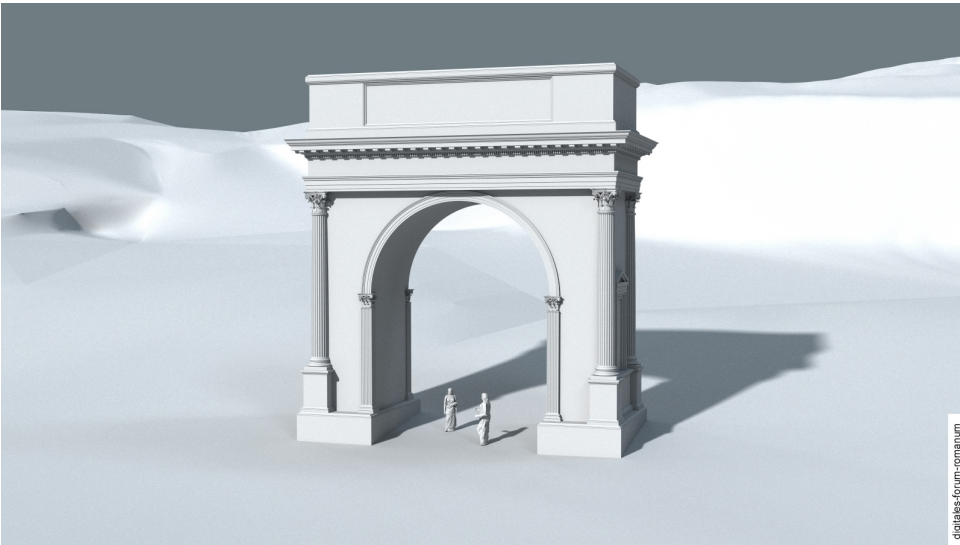
Abbildung 1 Actiumbogen (29 v.Chr.)

Nutzung von Bildern und Texten aus dem ‚digitalen forum romanum‘