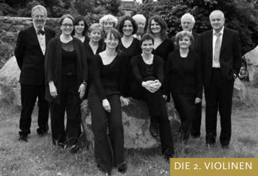
DIE 2. VIOLINEN