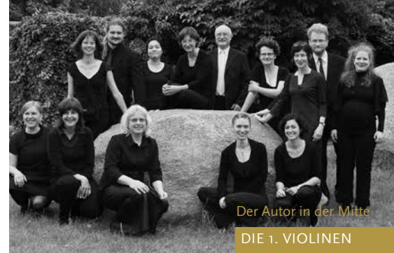
Der Autor in der Mitte